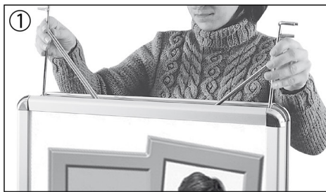
1.-3. Ref. Nr. BSAW = 1 Set

assembly instruction notice de montage indicaciones de montaje